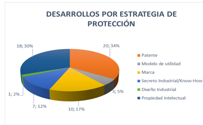
Gráfico 2: Desarrollos por estrategia protección de derechos propiedad intelectual e industrial